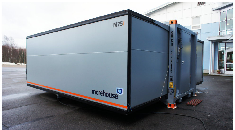
Kontti on CSC-luokiteltu. Avautuminen tapahtuu automaattisesti nappia painamalla.

Oy Morehouse Ltd Koritie 3 - FIN-77700 RAUTALAMPI puh. 017 2648 600 morehouse@morehouse.fi www.morehouse.fi NCAGE A546G