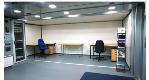
Kuten muissakin Morehouse-konteissa, kalusteet kulkevat kontin mukana.